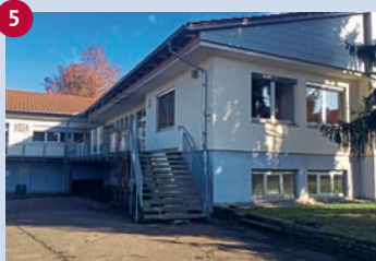
Gewerbe Akademie Standort Appenweier Rheinstraße 21 77767 Appenweier Tel.: 07805 95868-0