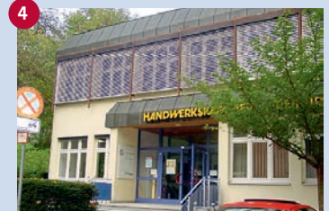
Gewerbe Akademie Standort Lahr Ludwig-Frank-Straße 16/1 77933 Lahr Tel.: 07821 91269-0